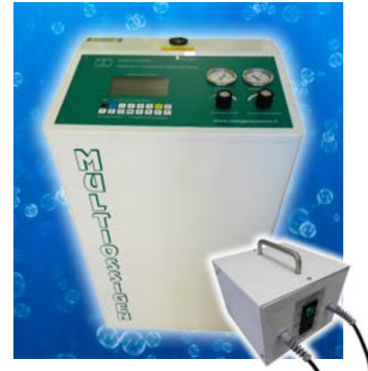
Fig. 1 - MEDICAL 95 CPS, Apparecchiatura per Ossigeno Ozono Terapia. Certificata 93/42/CEE Classe 2A